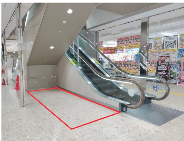
A区画 正面エスカレーター下